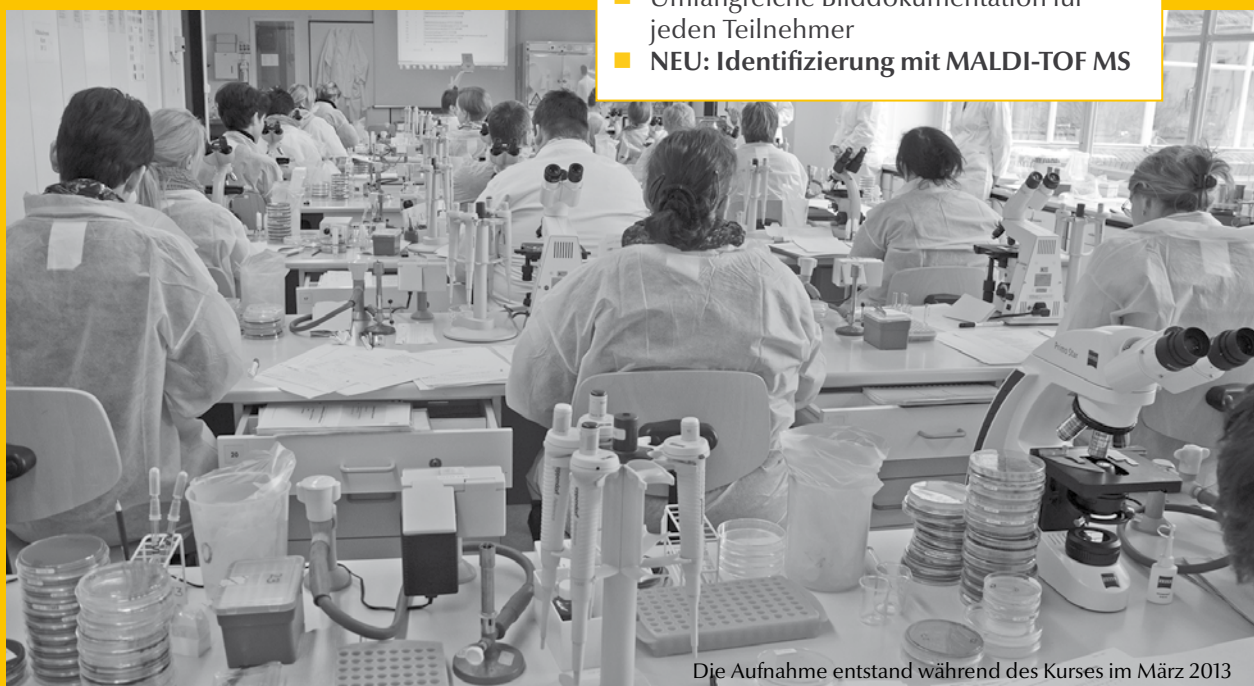
Die Aufnahme entstand während des Kurses im März 2013