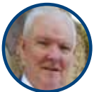
Klaus Feuerhelm Regierungspräsidium Tübingen